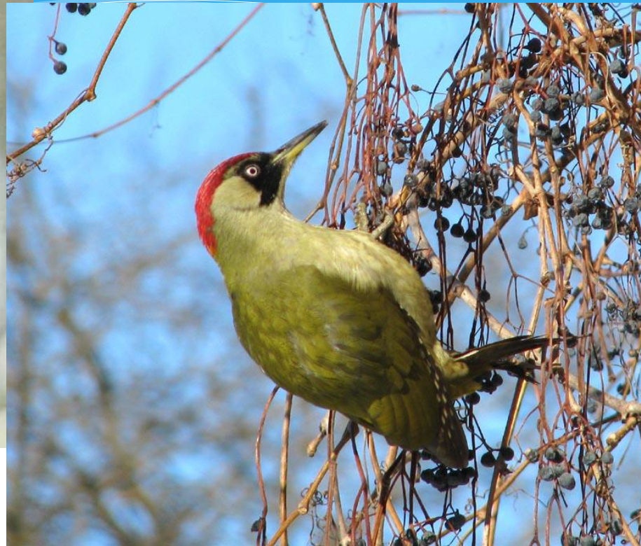
Дятел / Picus viridis /

Середнього розміру дятел з яскравим забарвленням. Схожий на жовну сиву ( Picus sapor ), з якою нерідко плутають. Дорослий самець зверху оливково-зелений; на голові червона «шапочка»; довкола ока чорна пляма, яка переходить у чорні «вуса» з червоною плямою в центрі.