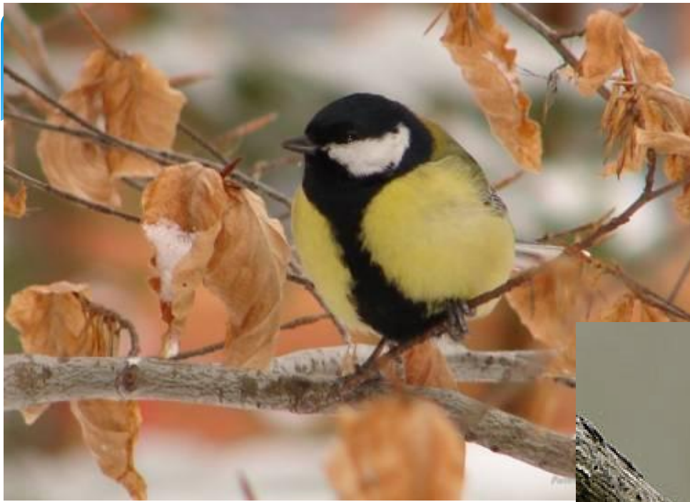
СИНИЦЯ /Parus major/