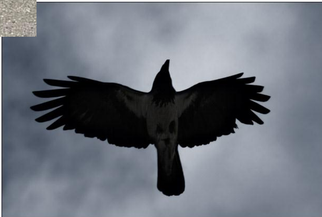
Ворон /Corvus corax /

Чималі блискучо-чорні птахи з міцним великим дзьобом. Маса до 1300 г. Молоді птахи чорні, без блиску, з буруватим відтінком. У природі їх визначають за розмірами, чорним кольором оперення і характерним криком «кру-кру» (за що дістали свою українську назву). Шлюбні ігри в повітрі, коли птахи кружляють і ганяють один одного, починаються дуже рано — в лютому і навіть у кінці січня.