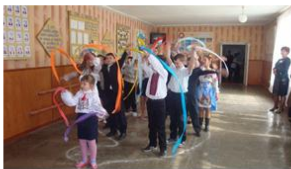
Флешмоб «Голуб МИРУ!».