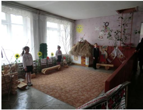
Етнографічний куточок в початковій школі.