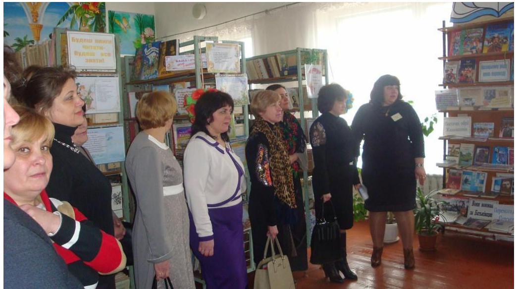
В шкільній бібліотеці...