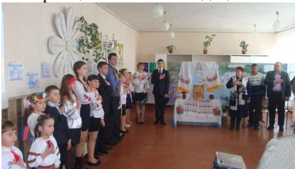
Звучить гімн ДЕРЖАВИ.