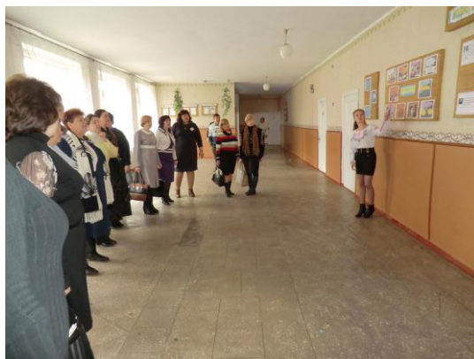
Презентація напрямку «Школа сприяння здоров'ю».